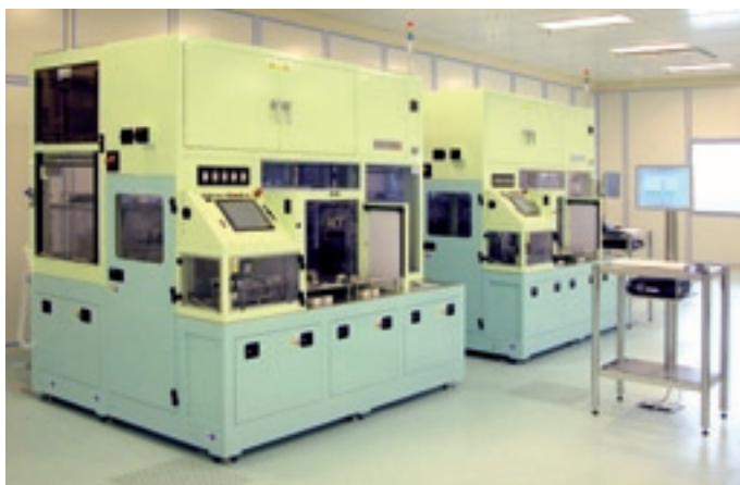
Abb. 3: Hellgelbe Pfosten und Riegel sowie blaue Rahmen ergeben eine sinnvolle rhythmisierende Struktur und wirkt damit der Monotonie entgegen, ohne von der Arbeit abzulenken.