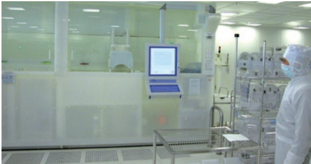
Abb. 2: Gestaltungsanonymität wie auch fehlende optische Reize führen zur schnelleren Ermüdung und Konzentrationsproblemen.